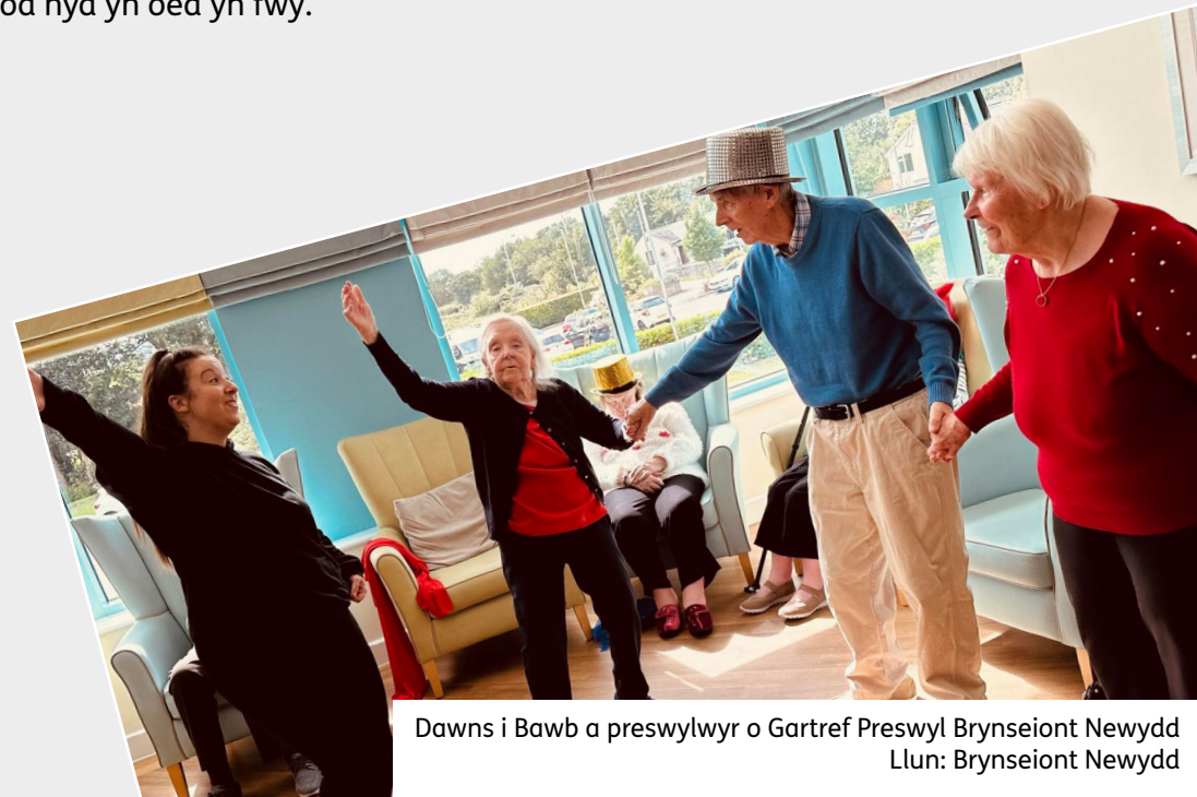
Dawns i Bawb a preswylwyr o Gartref Preswyl Brynseiont Newydd

Mae ein hastudiaeth o'r ffordd y mae buddion economaidd a swyddi'n cael eu cynhyrchu gan wahanol fathau o sefydliadau celfyddydol yn dangos bod yr enillion mwyaf mewn effaith economaidd (GVA) a chyflogaeth yn debygol o gael eu gwneud trwy fuddsoddiad cynyddol mewn sefydliadau canolig eu maint, gyda grantiau yn y £100,000 - £250,000, felly yn dibynnu ar ble y caiff unrhyw arian ychwanegol ei wario, gallai'r elw economaidd fod hyd yn oed yn fwy.