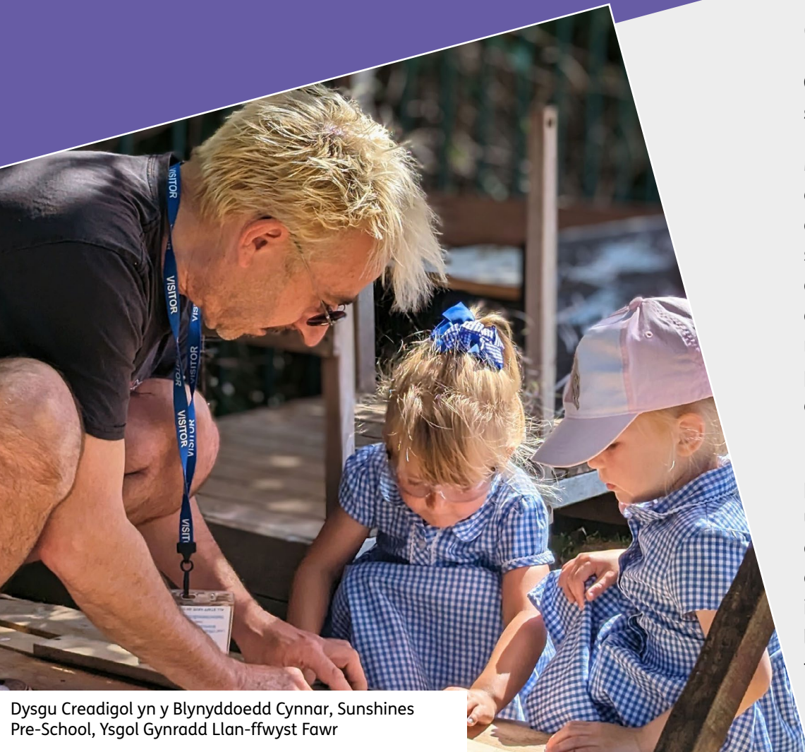
Dysgu Creadigol yn y Blynyddoedd Cynnar, Sunshines Pre-School, Ysgol Gynradd Llan-ffwyst Fawr

Mae ein rhaglen Dysgu Creadigol yn cefnogi ysgolion, dysgwyr, ac athrawon ac mae wedi darparu dros 140,000 o gyfleoedd dysgu ers 2015. Mae'r rhaglen hefyd wedi darparu dros 4,600 o gyfleoedd i athrawon gefnogi eu dysgu proffesiynol.