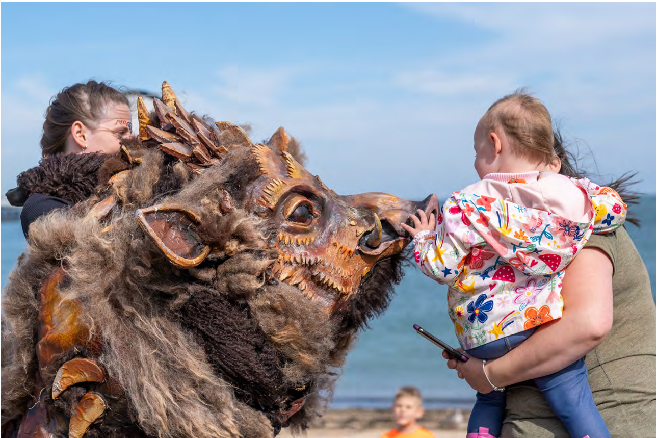
LLAWN, Penwythnos Celfyddydol Llandudno, Mostyn

Wrth symud yn ein blaenau, byddwn ni'n parhau i fod yn genhadon angerddol dros y celfyddydau. A byddwn ni'n parhau i chwarae rhan gyffrous wrth helpu'r celfyddydau yng Nghymru i lewyrchu. Fe wnawn ni hyn trwy greu sefydliad effeithiol sy'n 'addas at ei bwrpas', ac sy'n cael ei werthfawrogi i'r un graddau gan ei ddefnyddwyr, ei bartneriaid a'i staff.