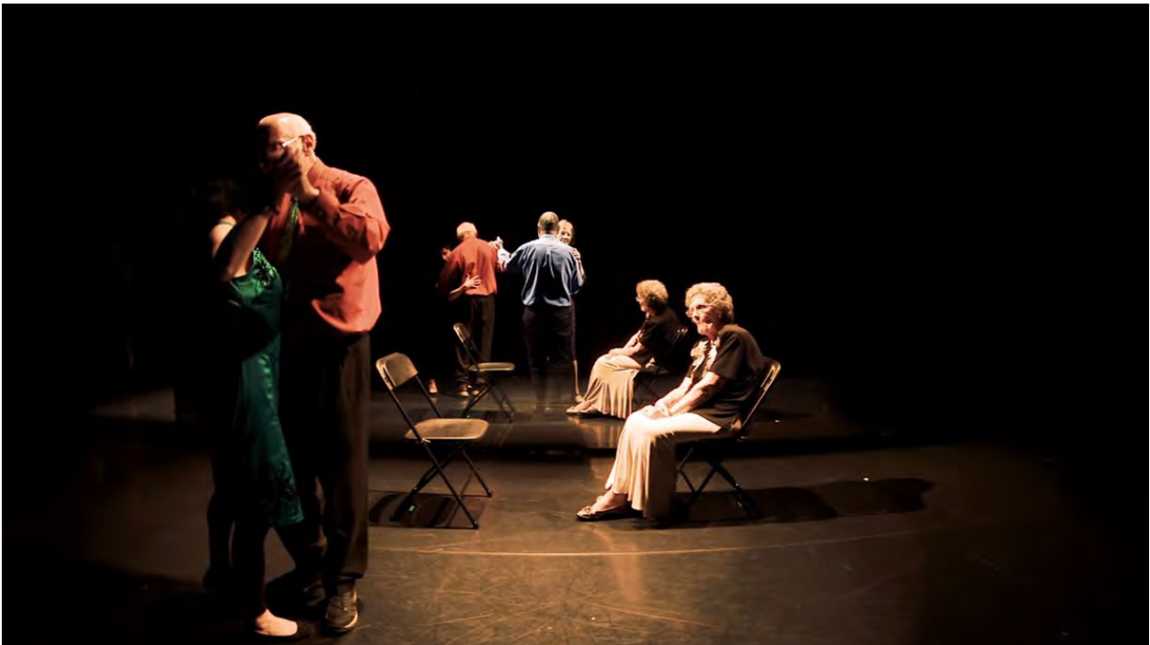
Reflections, ffilm gan Fearghus Ó Conchúir, Dance for Parkinsons, Cwmni Dawns Cenedlaethol Cymru

Mae'r celfyddydau'n cyfoethogi llesiant dinasyddion ar draws Cymru gyfan. Maen nhw'n dod â bywyd ac yn rhoi ystyr i amrywiaeth o strategaethau sy'n gosod y sylfaen at gyfer polisi cyhoeddus. O artistiaid cymunedol i'r diwydiannau creadigol, o'r celfyddydau ac iechyd i dwristiaeth ddiwylliannol, o gelfyddyd gyhoeddus i adfywio canol trefi, daw'r celfyddydau ag ystyr a mwynhad i'n bywydau pob dydd. Maen nhw'n creu ac yn cynnal swyddi, yn cyfoethogi gwasanaethau addysg ac yn tynnu pobl ynghyd. Mae'r celfyddydau'n bwysig am eu bod nhw'n cyffroi, yn ysbrydoli ac yn diddanu pobl.