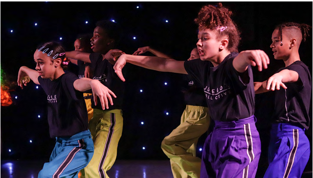
Jukebox Collective, Gŵyl Dydd Dewi, Canolfan Mileniwm Cymru

Gellir cael rhagor o wybodaeth am Gyngor Celfyddydau Cymru trwy fynd i wefan Cyngor Celfyddydau Cymru, ac ar Gymru a Chaerdydd yma https://www.visitwales.com/ a https://www.visitcardiff.com/