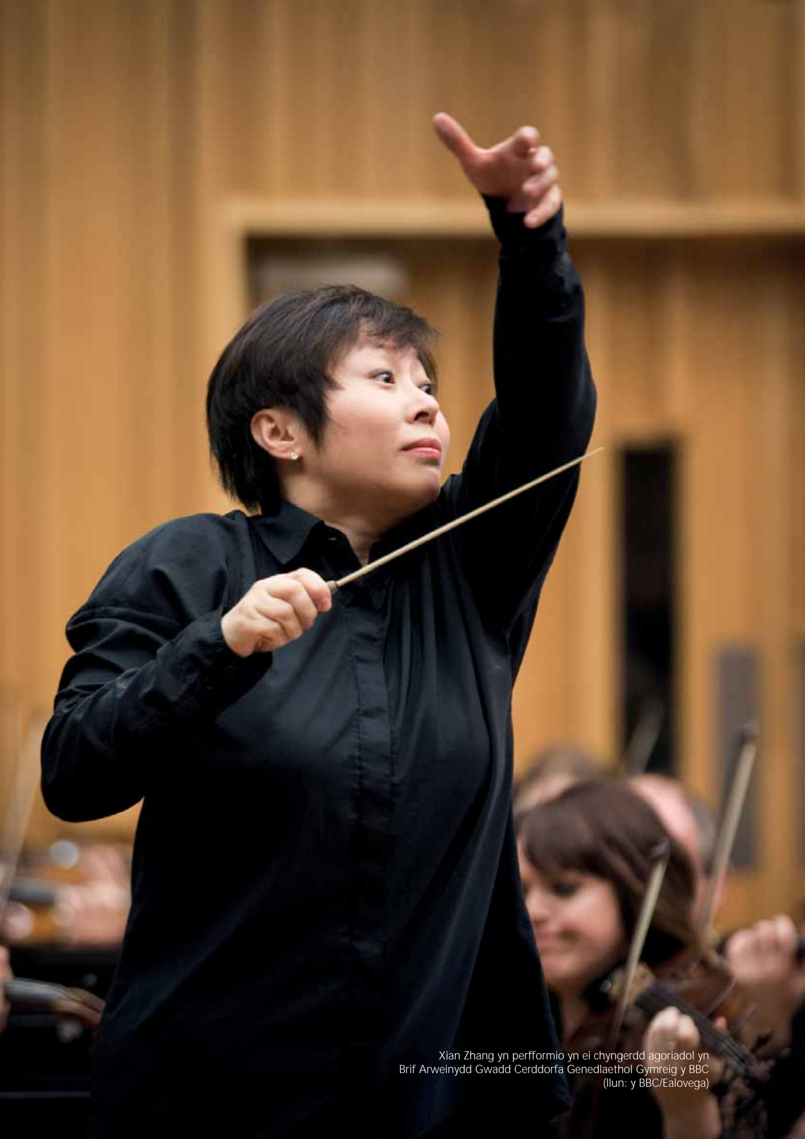
Xian Zhang yn perfformio yn ei chyngerdd agoriadol yn Brif Arweinydd Gwadd Cerddorfa Genedlaethol Gymreig y BBC