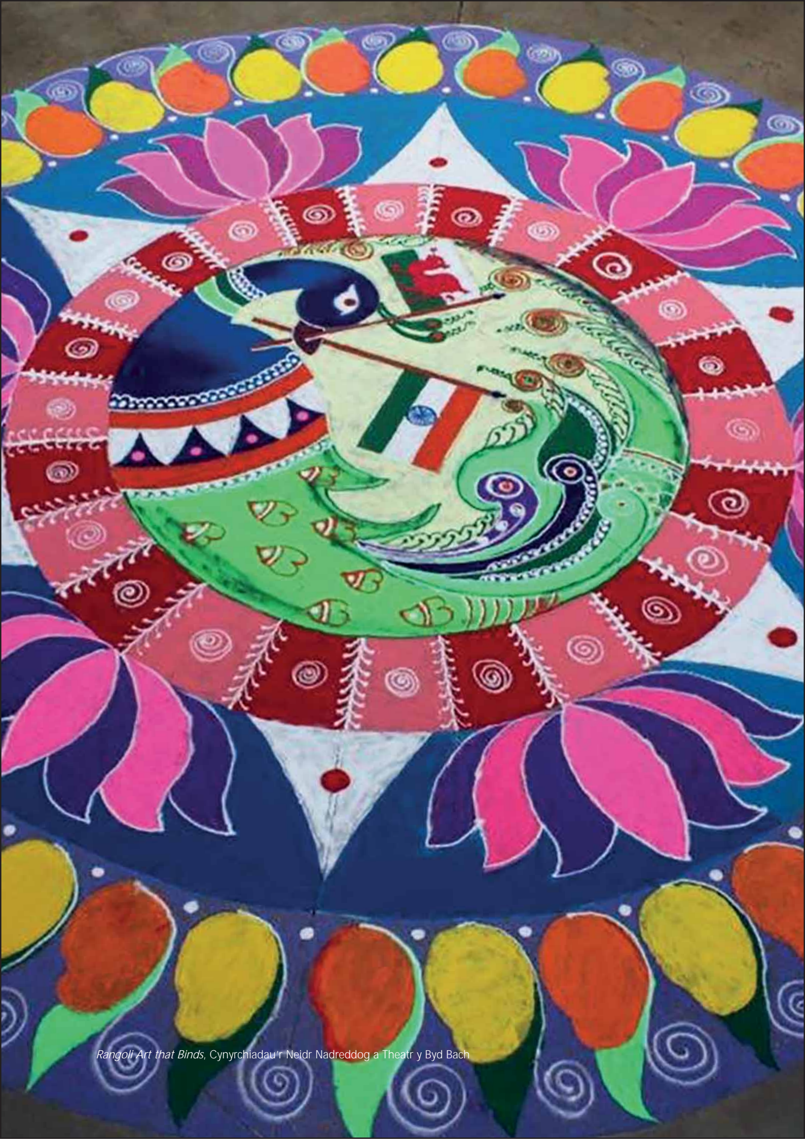
Rangoli Art that Binds, Cynrychiadau'r Neidr Nadreddog a Theatr y Byd Bach