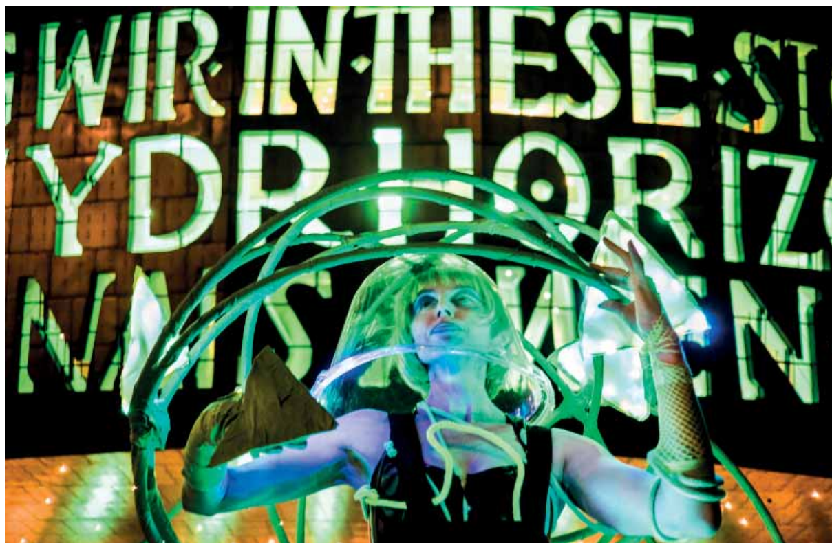
Carnifal y Môr, Eisteddfod Genedlaethol, Caerdydd

Mae Cymru yn newid, ac yn newid yn gyflym. Mae cymdeithas hael, deg a goddefgar yn gwerthfawrogi a pharchu creadigrwydd ei holl ddinasyddion. Mae'n gymdeithas sy'n cofleidio cydraddoldeb ac yn dathlu gwahaniaeth, ble bynnag y'i gwelir mewn hil, rhyw, rhywioldeb, iaith, oedran neu anabled. Y gwahaniaethau hyn, o bosib, yw ein hasedau cryfaf. Maent yn darparu naratif diwylliannol unigryw i Gymru ac yn cysylltu ag eraill yn rhyngwladol. Mae ein diwylliant wedi'i gyfoethogi a'i chwyddo o ganlyniad i ddysgu oddi wrth brofiadau eraill o amgylch y byd. Ac wrth i ni archwilio diwylliannau ymhellach i ffwrdd, rydym yn dysgu mwy amdanom ni ein hunain.