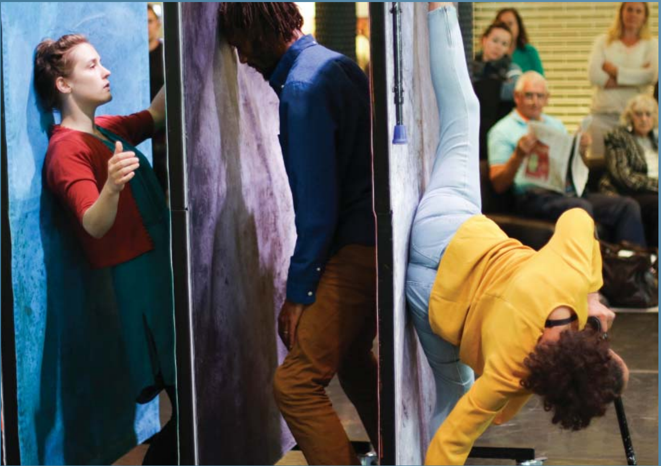
Elevator, Gŵyl Undod 2016, Hijinx