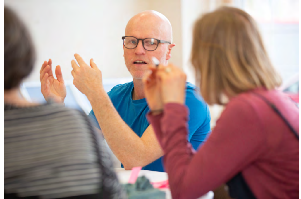
Diwrnod Rhannu

Y nod yw archwilio dull newydd o ariannu hirdymor ar gyfer artistiaid a chymunedau unigol, gan ddefnyddio arian loteri i greu galwad agored fydd yn edrych ar bosibiliadau gyda phwyslais cryf ar ymchwil.