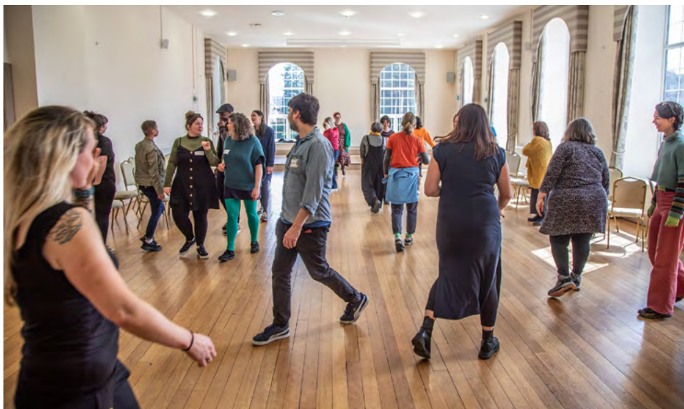
Diwrnod Rhannu

Ni fyddwn ni'n ariannu cais lle nad oes ffi ar gyfer chi eich hun neu eich cydweithwyr neu ddim ond ffi isel iawn, iawn sydd yn y gyllideb. Hoffem weld eich bod wedi cyfeirio at gyfraddau safonau diwydiant sy'n berthnasol i'ch ymarfer chi a dylech chi o leiaf dalu cyfraddau lleiaf y diwydiant. Lle nad oes cyfraddau lleiafsymiol i'r diwydiant ar gael, rhaid ichi dalu'r Cyflog Byw Cenedlaethol o leiaf.