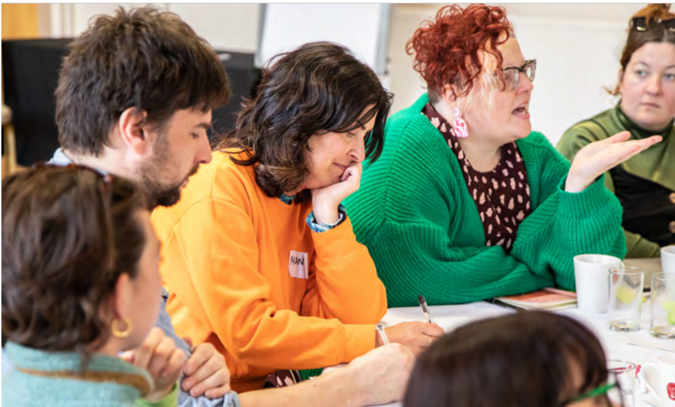
Diwrnod Rhannu

Rydym yn chwilio am syniadau fydd yn darganfod ffyrdd creadigol o weithredu a gosod sail cadarn i ddatblygu at y dyfodol. Rydym eisieu ceisiadau fydd yn greadigol a rhagweithiol wrth fynd i'r afael â'r cwestiwn.