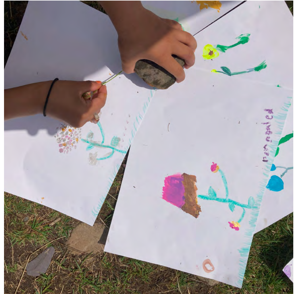
Helfa Drysor Blodau Gwyllt, Baladeulyn

Gallai'r wefan hon eich helpu i olrhain yr oriau gwirfoddol a roddir i'r prosiect: www.volhours.com